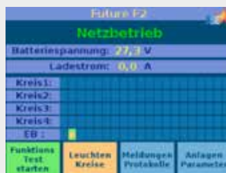
Leuchte wird abgefragt